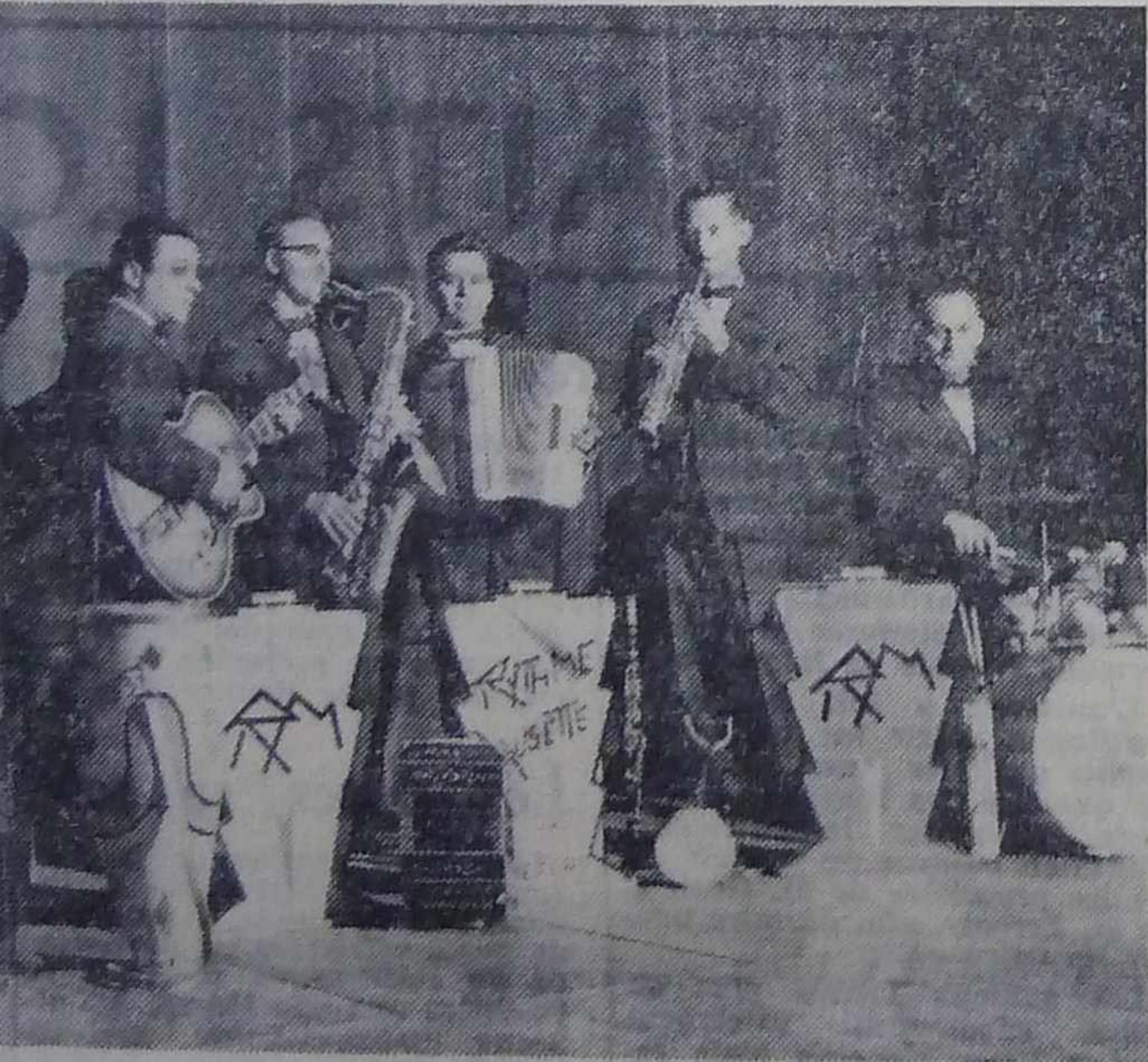
Ils animeront le bal des conscrits

grand salon de l'Hôtel Bardin. Animé par le grand orchestre belfortain Rythme-Musette, encore peu connu dans notre région, mais d'un rare dynamisme, les jeunes