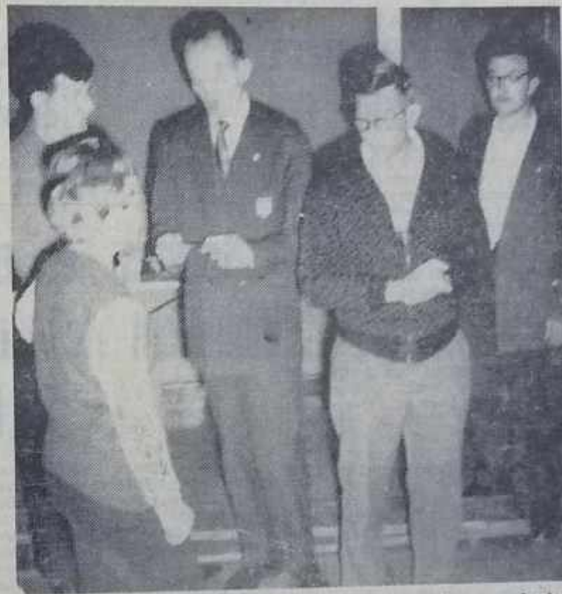
Un groupe de candidats écoute les instructions d'un examinateur

Ce soir mardi dans la salle du réfectoire de la Sté Thecla aura lieu la proclamation des résultats.